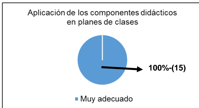
Figura 2. Sistematización de los componentes didácticos en planes de clases

El 80%-(12) de los docentes opinaron que, las relaciones alumno-profesor, se da de manera horizontal, es decir centrado en el alumno y el restante (20%-3) juzgaron que este indicador se da de modo mixto, centrado en el alumno-profesor.