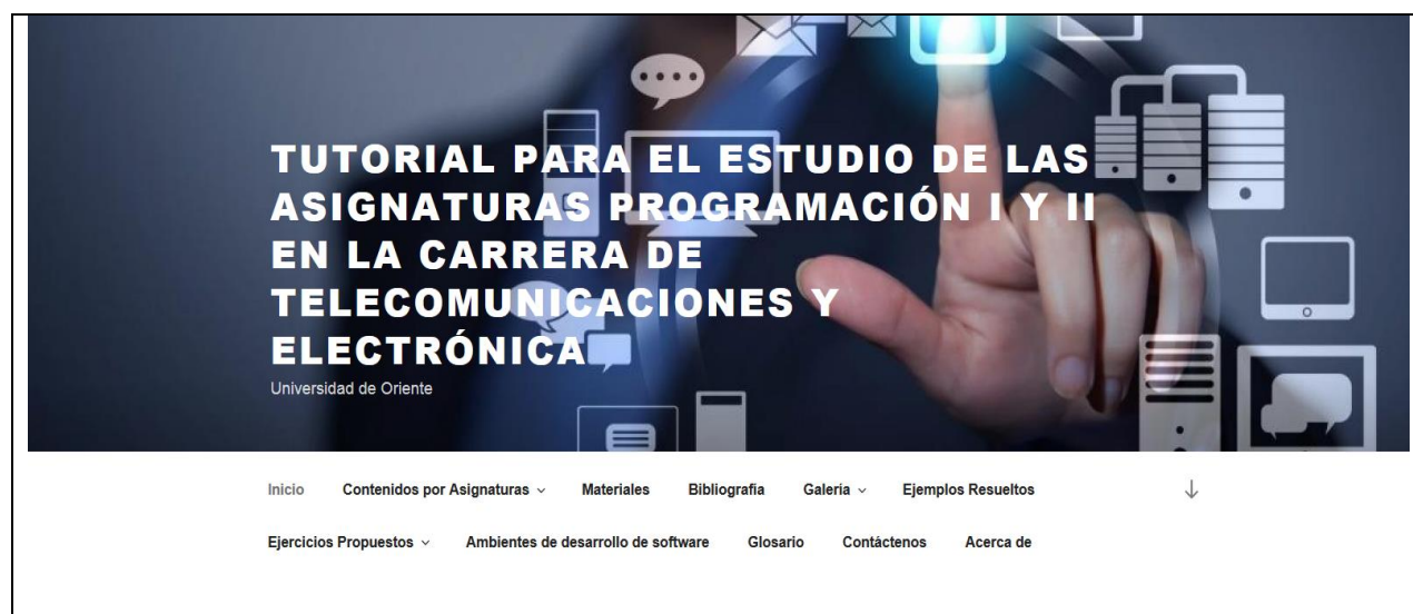
Figura 1 Menú Principal