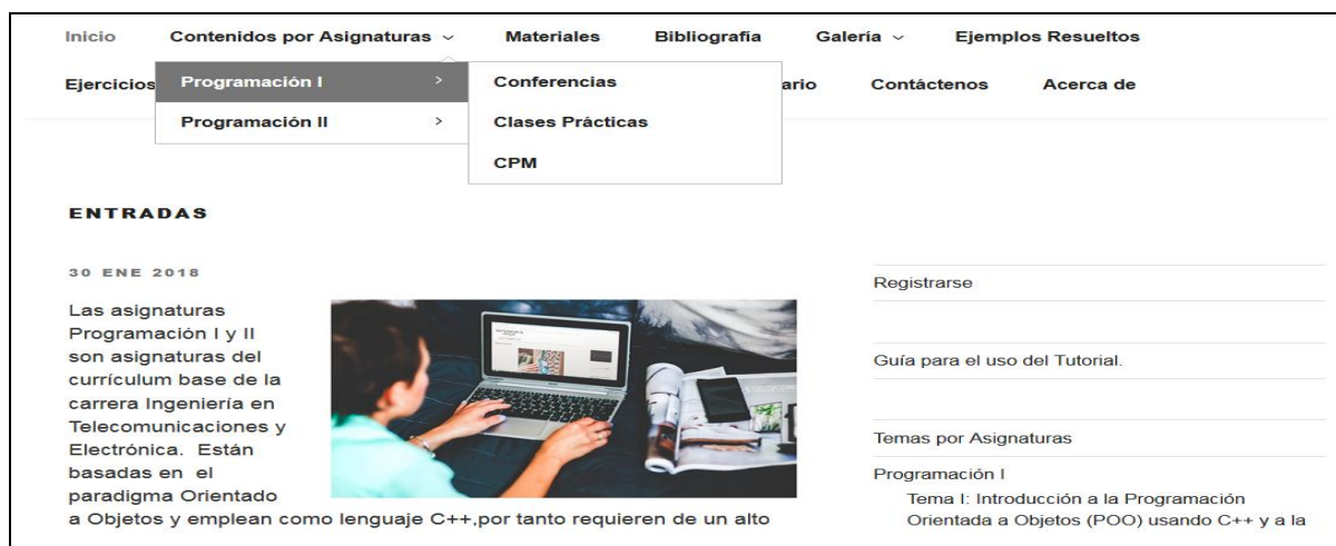
Figura 2 Vista de las actividades por asignaturas y menú lateral.

Además, en la página principal podemos encontrar un menú lateral, con los contenidos organizados por temas, de manera que el usuario puede escoger la forma en la que desea estudiar el contenido (Figura 2).