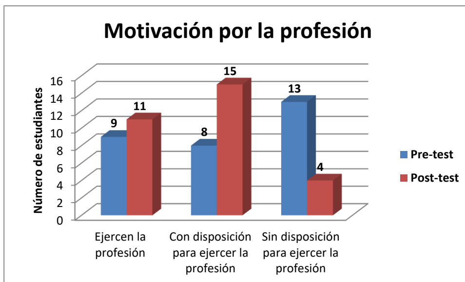
Figura 2. Motivación por la profesión.